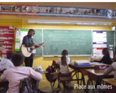
Place aux mômes

Les membres du bureau travaillent autour de l'élargissement des connaissances du public comme l'animation d'un blog, la rédaction d'articles (blog, site web, journal, etc.) ou la réalisation de vidéos (blog, TV accueil) etc.